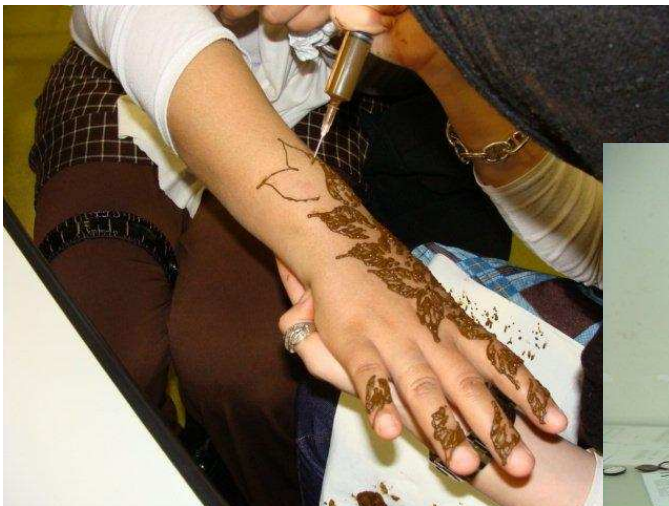
Henné et atelier détente par l'association « Femmes Actives »